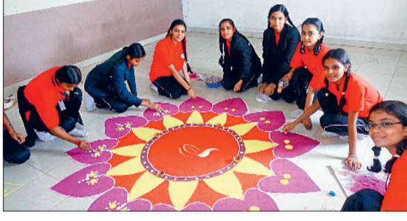
हरिभूमि न्यूज ►► खरोरा